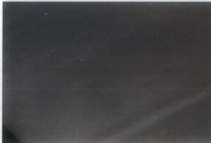
Foto 2: Untersuchungsmaterial Soudaseal Cleanroom nach einer Inkubationszeit von 28 Tagen ohne Pilzwachstum (50fach vergrößert)